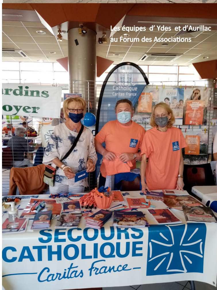
Les équipes d'Ydes et d'Aurillac au Forum des Associations