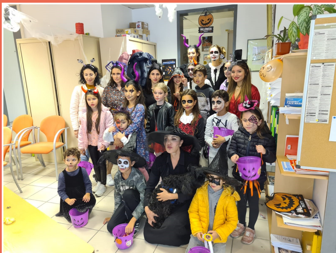
Halloween à l'AGORA Novembre 2021