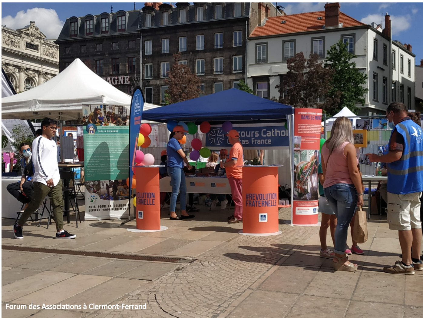
Forum des Associations à Clermont-Ferrand