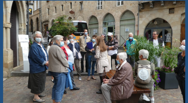
L'Atelier cuisine à Aurillac en visite à Figeac et au Musée des écritures.