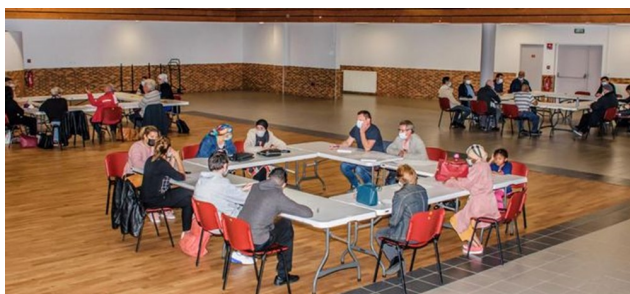
Volontaires et acteurs locaux de l'emploi, dans la phase de préparation du dossier de candidature.

Souhaitons bon vent à cette jeune équipe du Secours catholique qui s'inscrit de façon harmonieuse dans le schéma de développement des activités du territoire Clermont-Limagne.